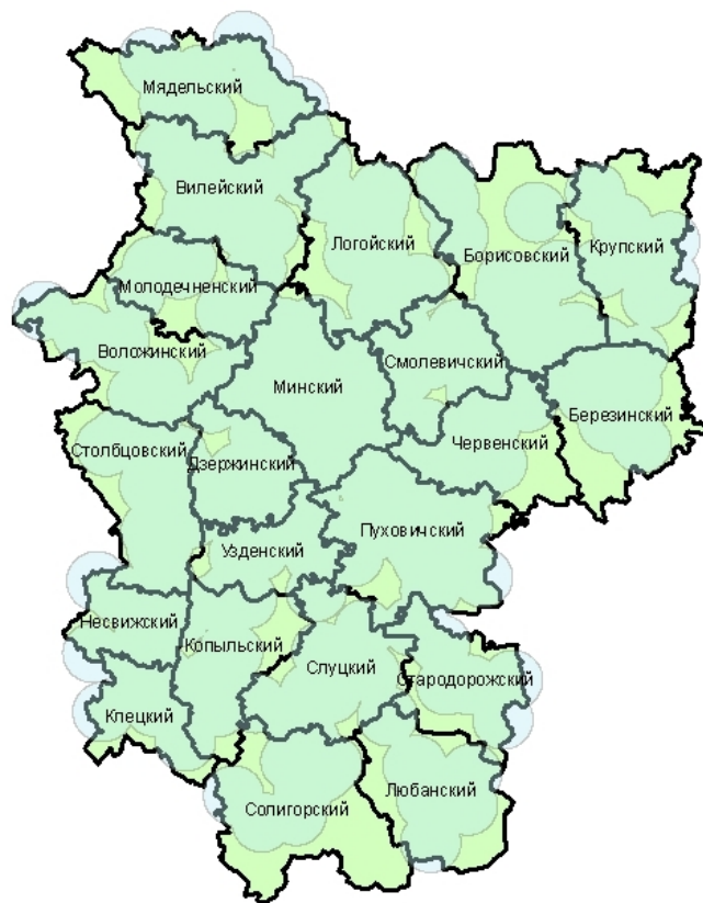
Рис. 1. Расположение 10-км буферных зон вокруг базовых станций операторов Velcom, МТС и Life

Коэффициент покрытия Минской области 10-км буферными зонами всех трех операторов равен 93,1%. Наименьшую площадь суммарное покрытие сотовой связи отмечается в Березинском (85%), Крупском (86%), Борисовском (85%), Солигорском (86%) районах.